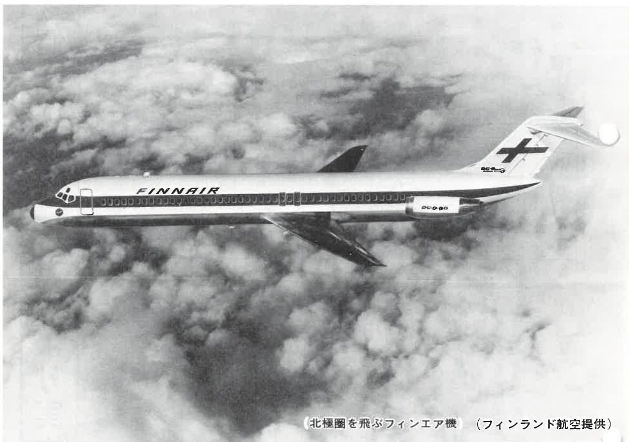
北極圏を飛ぶフィンエア機