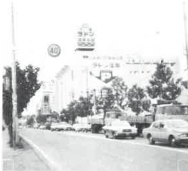
ラドン温泉会館の外観

全館四階のうちラドンに使用されている面積は千六百坪で、一階フロントで入浴料の支払いと脱靴、じゅうたん敷きのまわり階段を二階へ昇る。二階は右側に大広間二つ、手前は大演芸場、他はレストラン。左側は受付カウンター、奥がラドン入口。そばには看護室があり安心感を与えている。脱衣場における約五百のロッカーも悠々自適?と許り一方に団地型に林立して鎮座し、通路はもと