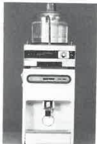
ミネラルウォーター自動製造機 AC 100V・22ℓ・冷温兼用型

糖質食品（ごはん・パン・めん 類・砂糖等）は肥満などの一番大 きな原因となりますので、十分注 意が必要です。とくに日本人は主 食偏重の食事をしがちなので、で きるだけおかずをたくさんとり、 糖分を控えるような食事を考慮す べきです。